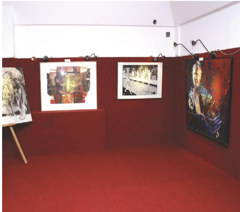
La muestra expone la obra de varios artistas plásticos

El Subsecretario de Promoción Social y Políticas Culturales, Ricardo Castro se refirió a la muestra itinerante: "Que los vecinos puedan acercarse a disfrutar de lo que hacen artistas plásticos de nuestro país es la posibilidad de vincularnos con un aspecto tan esencial como lo es el arte nacional", y agregó "es un orgullo abrir nuevamente el Cine para esta muestra itinerante y que los vecinos empiecen a palpar lo que esperamos que sea el merecido espacio cultural que se merecen"♦