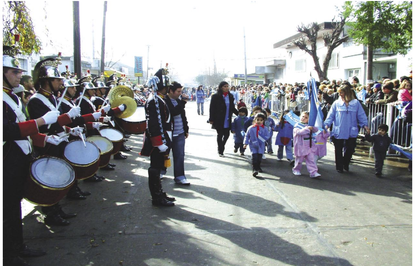
La banda tocando ante el paso de los niños de jardín de infantes

El "Camino al Bicentenario" es un eje en la tarea actual del Gobierno Municipal por lo que no estuvo ajeno en el mensaje alusivo: "Que en este Camino al Bicentenario busquemos las coincidencias por encima de las diferencias y escuchemos las necesidades de la comunidad. En el Concejo Deliberante están trabajando una orde-