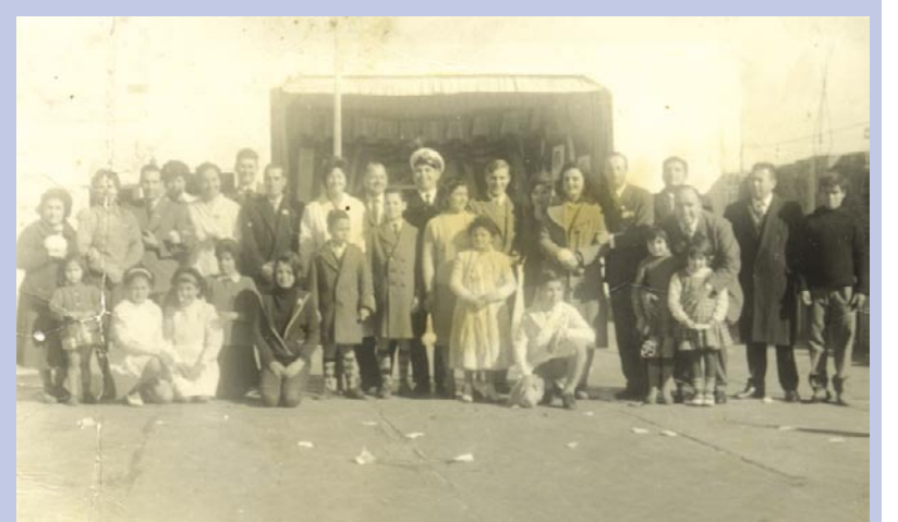
El Centro Comunitario en sus comienzos