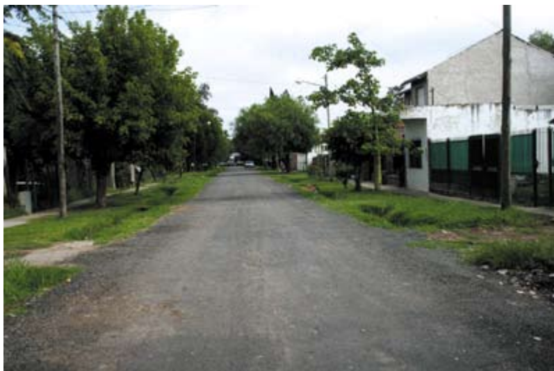
Calle Rivera ( Barrio San Alberto )

durante todo el año accediendo a una mejor estructura en los barrios periféricos y resolviendo el problema hidráulico. "Recibimos con entusiasmo las obras en Niceto Vega, porque traerán muchos beneficios para quienes vivimos en los alrededores" resaltó Dorita de Ituzaingó sur. ■