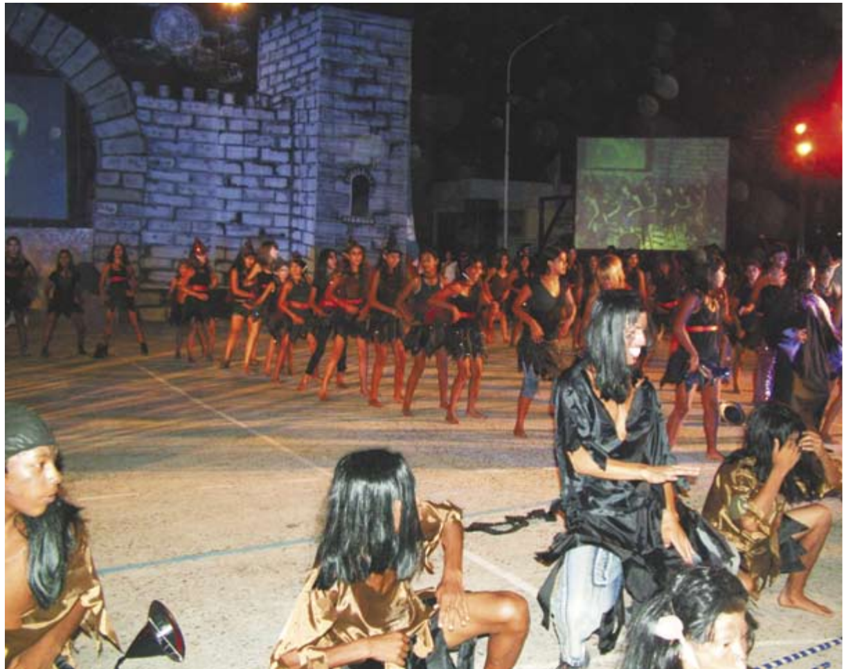
Los chicos caracterizados en plena actuación

Por otro lado el Intendente de Ituzaingó hizo hincapié en las obras que se están realizando en la cuenca Sotto- Forletti y el Saladero Chico "si Dios quiere, con estas