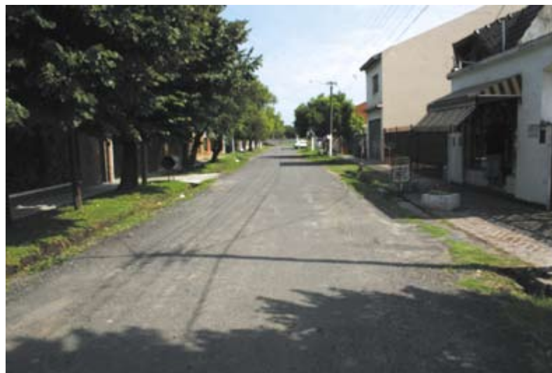
Calle Niceto Vega ( Ituzaingó Sur )