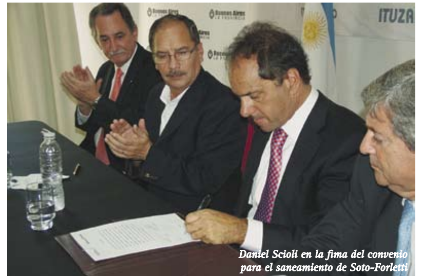
Daniel Scioli en la firma del convenio para el saneamiento de Soto-Forletti

se construirá un conducto que pasará por las calles Marañón, Lola Mora, Jacarandá, Del Ombú, De la Vidalita, Udaondo, Los Reseros, Balbín, Del Cielito, Alsina, De los Baqueanos y Repetto, entre otras.