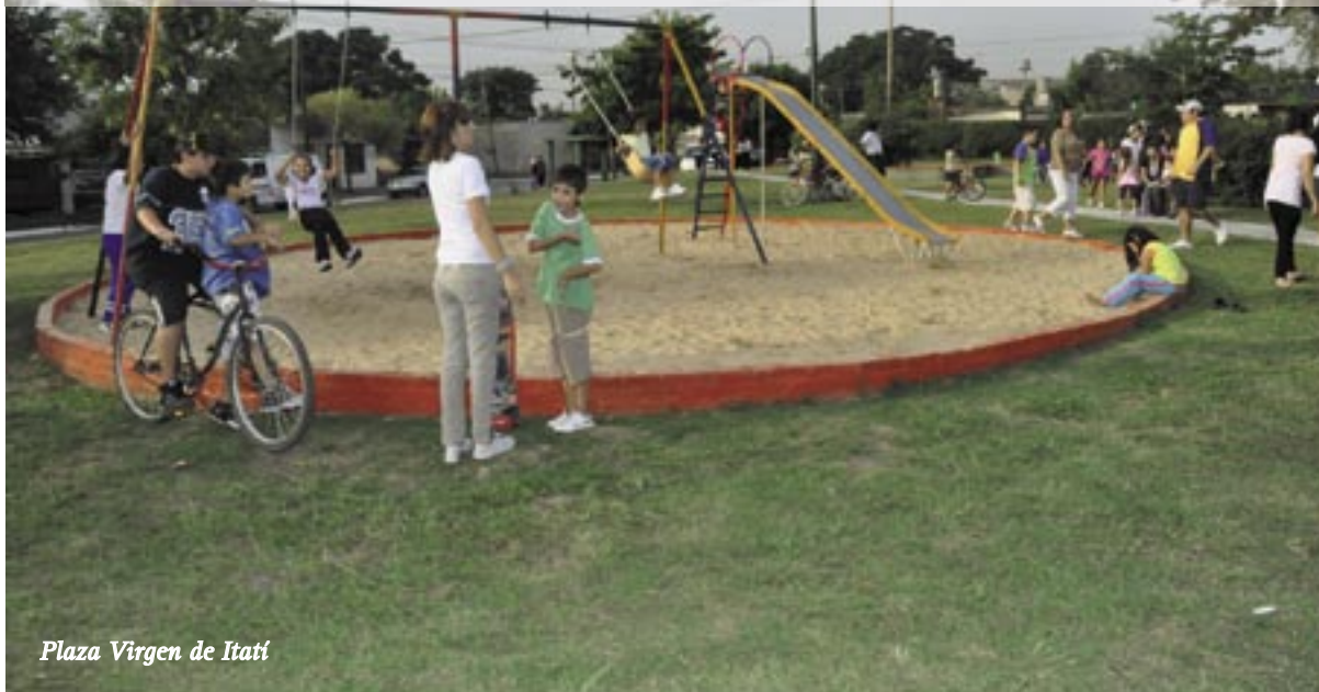
Plaza Virgen de Itatí

En el mes de marzo los vecinos de San Alberto participaron de dos importantes acontecimientos en su barrio. Las plazas Virgen de Itatí y San José Obrero fueron remodeladas a través de diversas obras que dieron como resultado su puesta en valor