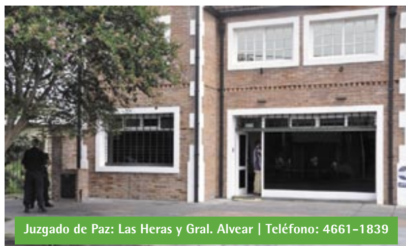
Juzgado de Paz: Las Heras y Gral. Alvear | Teléfono: 4661-1839