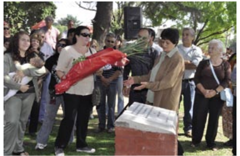
Placa recordatoria en la Plaza Atahualpa Yupanqui