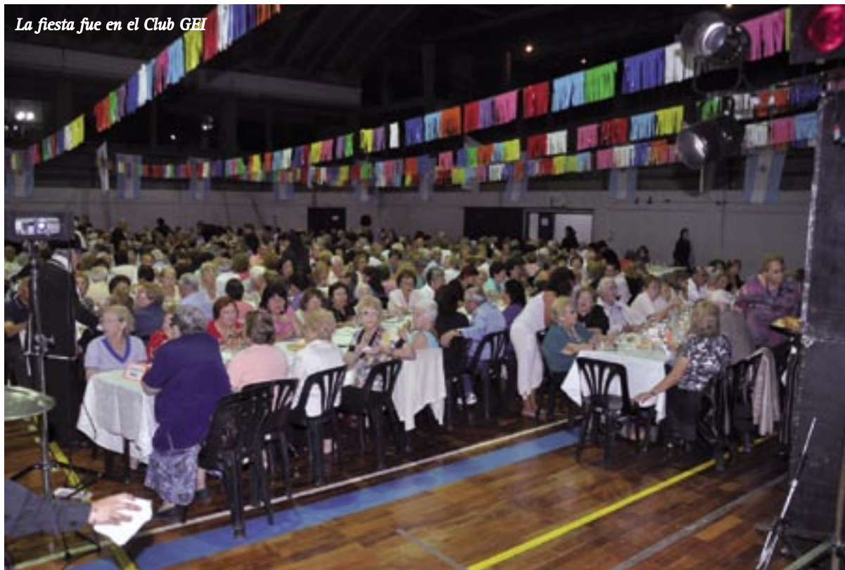
La fiesta fue en el Club GEI