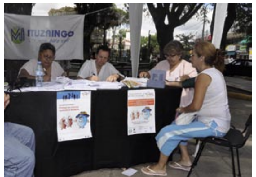
La Plaza 20 de Febrero contó con dos puestos ambulantes para los chequeos

También participaron de la jornada, los promotores de salud