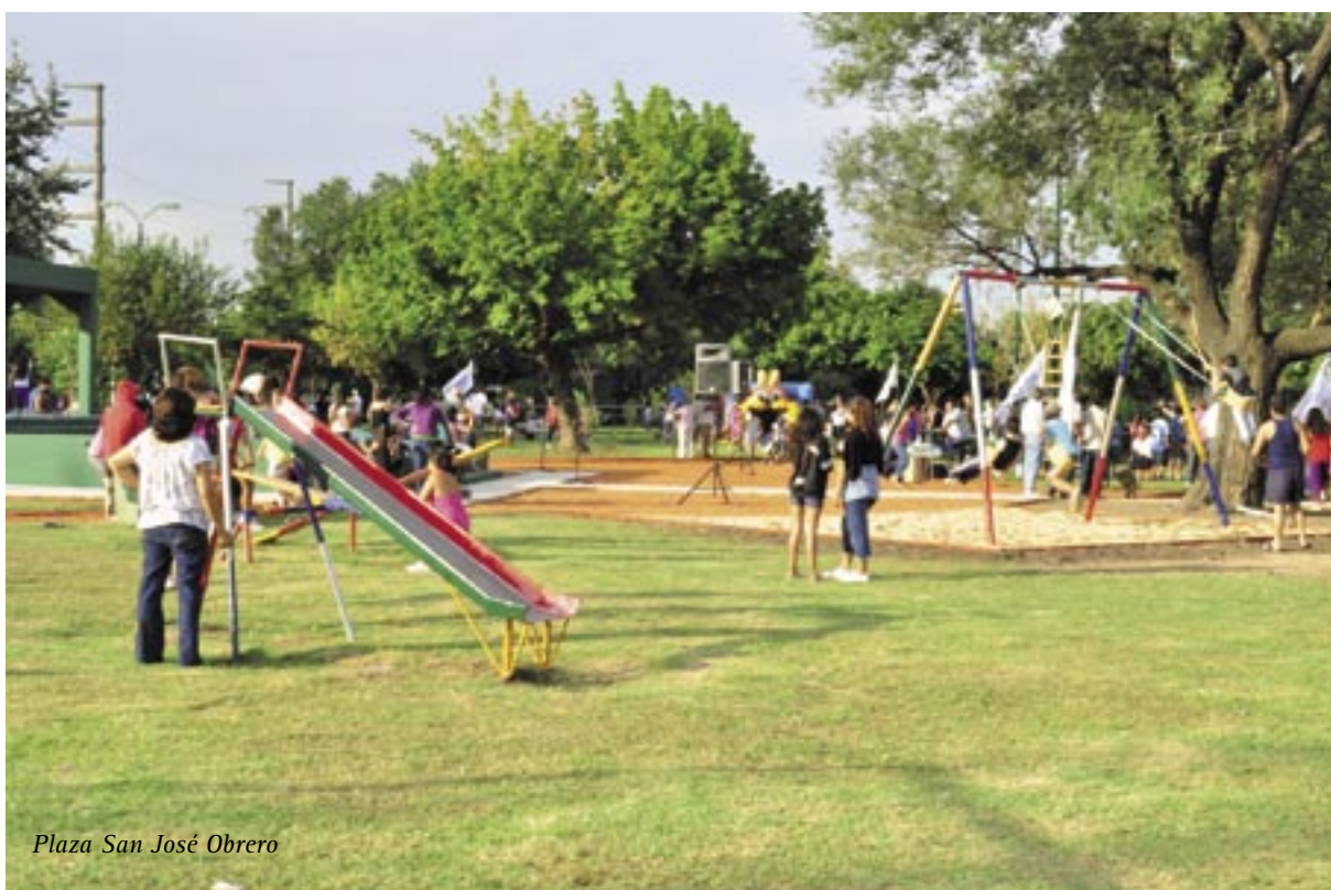
Plaza San José Obrero

remodelados, los asientos y mesas fueron reparados, el playón deportivo está mejorado y los juegos infantiles acondicionados, en cuanto a la iluminación se efectuó el recambio de los artefactos luminicos y se colocaron lámparas de sodio halogenado de bajo consumo. También se situó una bajada para discapacitados, se realizó la poda correctiva de la masa arbórea y se plantaron nuevos arbustos ■