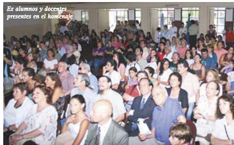
Ex alumnos y docentes presentes en el homenaje

"Creo que este aniversario es un buen ejemplo de lo que significa el trabajo, la vocación, el pensar en el país", concluyó Descalzo