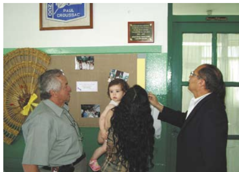
El Intendente y familiares de la Directora descubren una placa recordatoria

Por último, el Jefe Comunal y la familia descubrieron la placa recordatoria que se colocó junto a la sala de Dirección: "En recuerdo para quien dejó su corazón en esta escuela y en cada uno de nosotros"