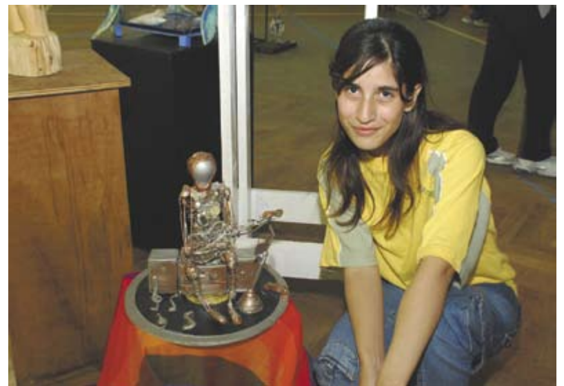
Los representantes de nuestro municipio tuvieron un excelente desempeño

Con respecto a las Menciones Especiales, se otorgó un puntaje determinado en cada área de los Juegos, lo que permitió valorar el esfuerzo y el compromiso asumido para tal fin ■