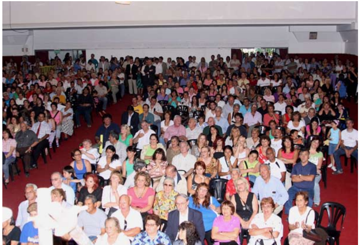
Gran cantidad de vecinos en el acto encabezado por el Gobernador y el Intendente

todas las inversiones realizadas en el municipio "tienen un efecto multiplicador que permiten crear trabajo", y aseguró que "también estamos luchando para que todo Ituzzaingó tenga agua corriente. Porque todas estas obras apuntan a mejorar la calidad de vida".