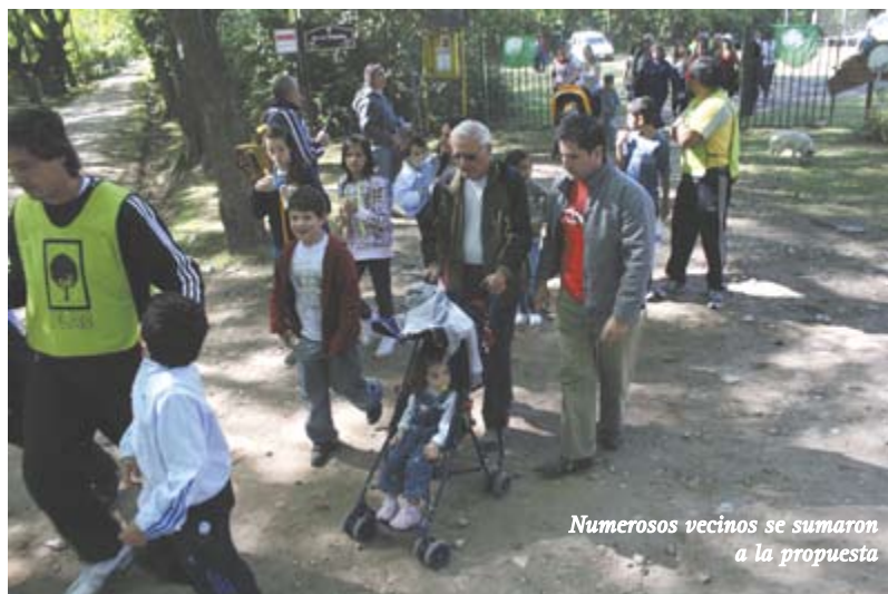
Numerosos vecinos se sumaron a la propuesta

Gran cantidad de vecinos participaron de la caminata organizada por PLAC a partir de una iniciativa nacional