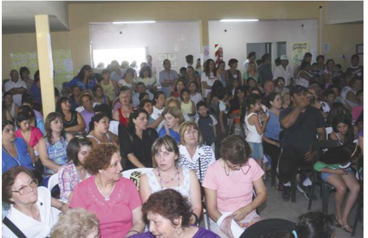
Alumnos y familiares en el cierre de los talleres

Previo a la entrega de los certificados de asistencia, Descalzo se dirigió a los alumnos y sus familias destacando que "la capacitación de cada uno de ustedes va a permitir superar los flagelos de cada barrio y les dará mejores perspectivas para el futuro". También apuntó a la necesidad de que las familias acompañen a los chicos "que desean estudiar y formarse" y adelantó que se realizarán reformas en el Centro de Desarrollo "para ampliar las instalaciones y que todos los que realizan las actividades aquí puedan tener mayores comodidades". A modo de exhibición de lo realizado durante el año, alumnos de gimnasia y guitarra mostraron ante sus familias y las autoridades municipales, los avances alcanzados a partir de la asistencia a los cursos gratuitos. Vale destacar que entre los alumnos presentes que recibieron su diploma, se encontraban los equipos finalistas de los Juegos Deportivos Buenos Aires La Provincia de las disciplinas Jockey Femenino y Fútbol Infantil.