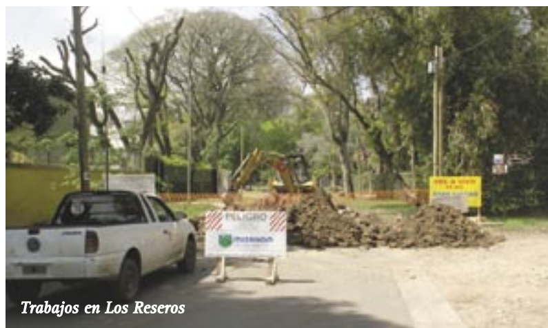
Trabajos en Los Reseros

La Secretaria de Infraestructura, informó que ya comenzaron las obras de pavimentación en esta calle de Villa Udaondo