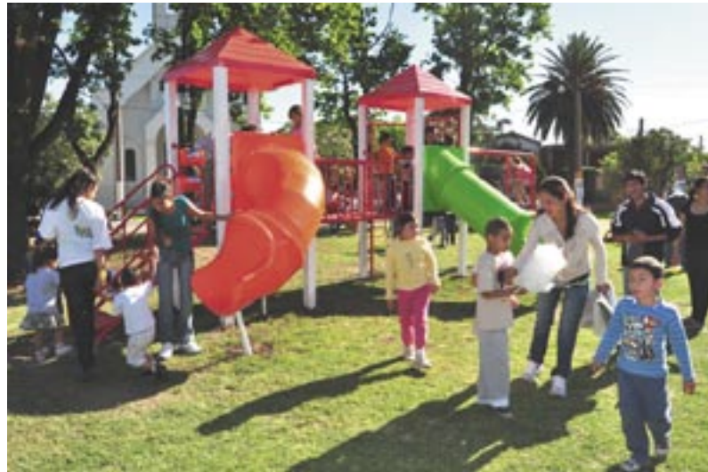
Los chicos ya están disfrutando de los nuevos juegos

Las plazas son espacios públicos en las que se concentran gran cantidad de actividades sociales y culturales, pero lo más importante es que es el ámbito en el que los chicos se divierten. Por eso, bajo el lema de "La Plaza es de Todos", el Gobierno Municipal inauguró obras en la Plaza Parque Alvear, para que los vecinos puedan disfrutar aún más de este espacio.