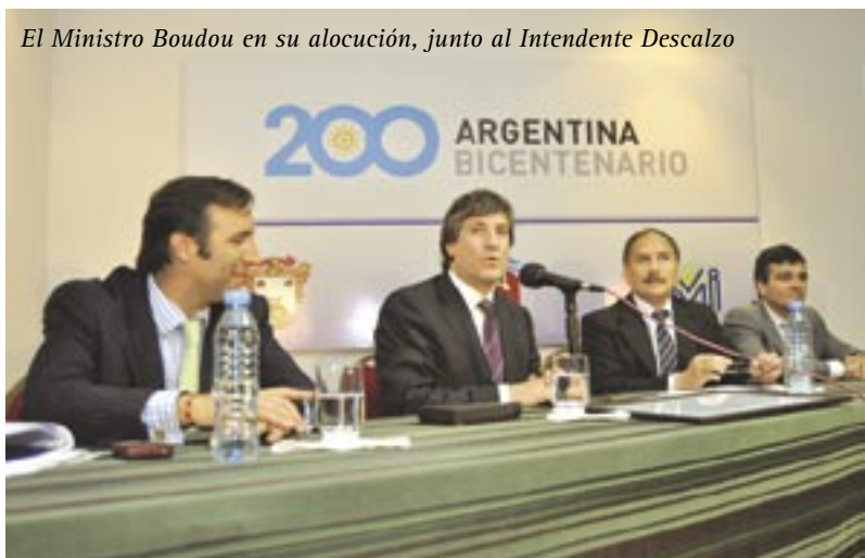
El Ministro Boudou en su alocución, junto al Intendente Descalzo

El Ministro de Economía Amado Boudou encabezó junto al Intendente Alberto Descalzo un encuentro en La Torcaza ante más de un centenar de empresarios e industriales de la zona de Ituzaingó, Hurlingham y Merlo.