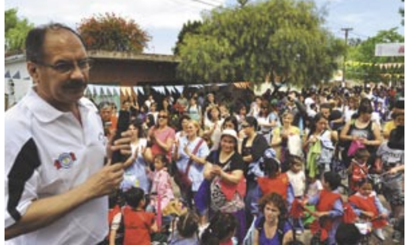
Descalzo habla a los numerosos vecinos que se sumaron a la jornada

Para supervisar el correcto desempeño del ejercicio, estuvieron presentes los profesores de educación