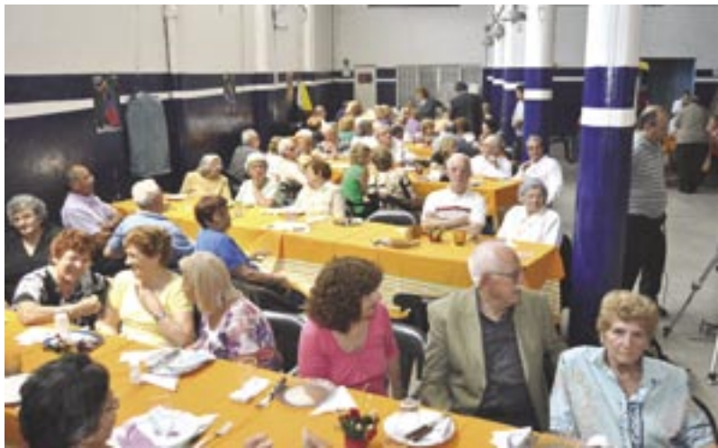
El agasajo se realizó en el club CAVA