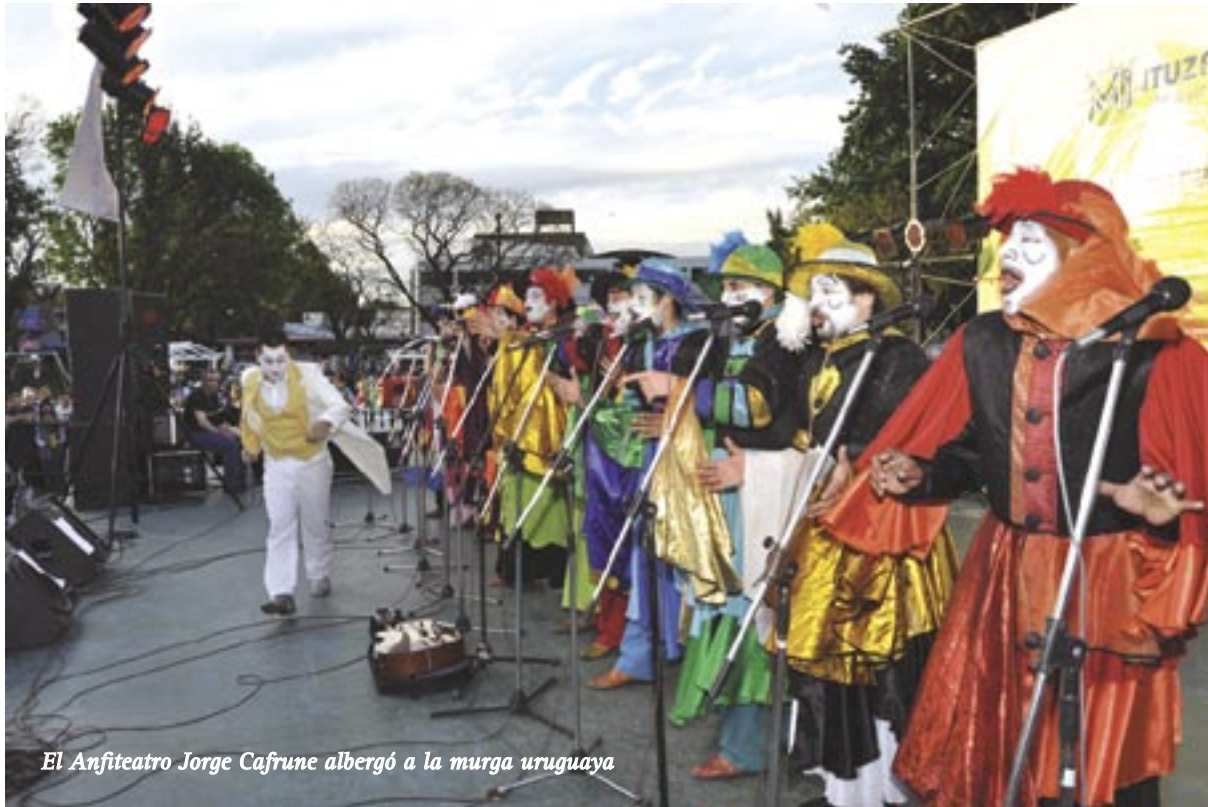
El Anfiteatro Jorge Cafrune albergó a la murga uruguaya

Para conmemorar el Día de la Madre, que se celebró el 18 de octubre, el Gobierno Municipal ofreció en la Plaza 20 de Febrero, un espectáculo murguero de la mano de "Araca la Cana", una de las murgas más históricas y reconocidas de Uruguay.