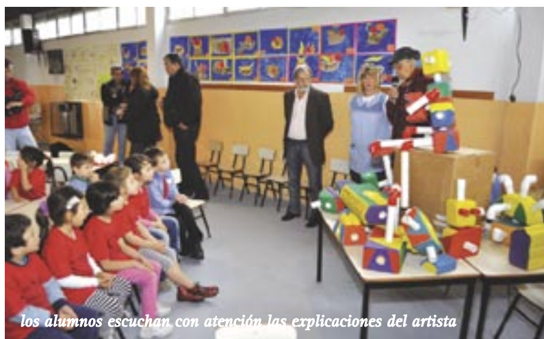
los alumnos escuchan con atención las explicaciones del artista