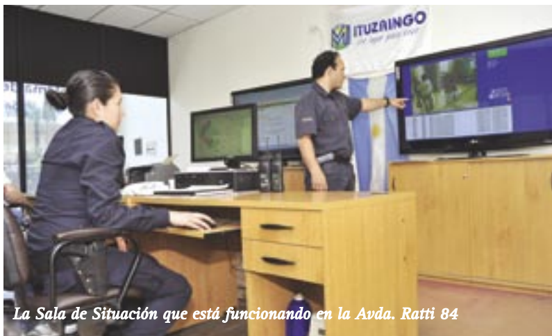
La Sala de Situación que está funcionando en la Avda. Ratti 84

En el marco del Programa de Seguridad en Red, se instalaron más cámaras de seguridad en lugares específicos del distrito