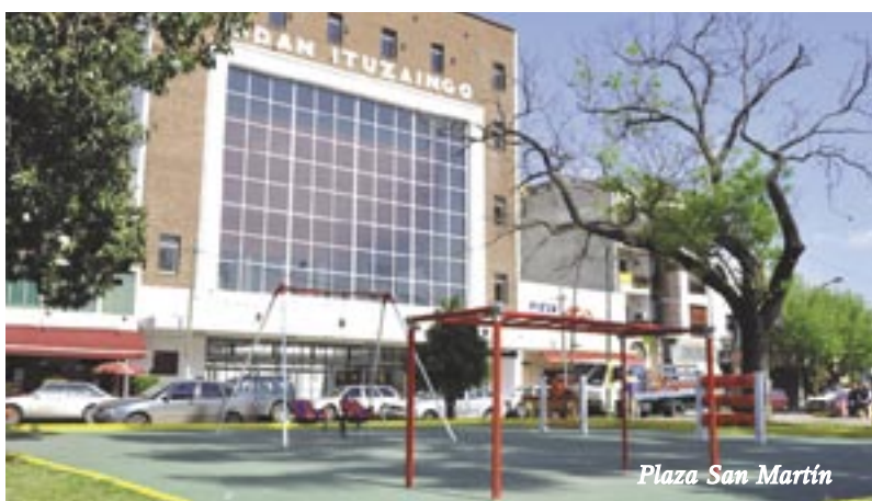
Plaza San Martín

En las Plazas San Martín y Atahualpa Yupanqui se instalaron sectores de juegos integradores destinados a niños con capacidades diferentes