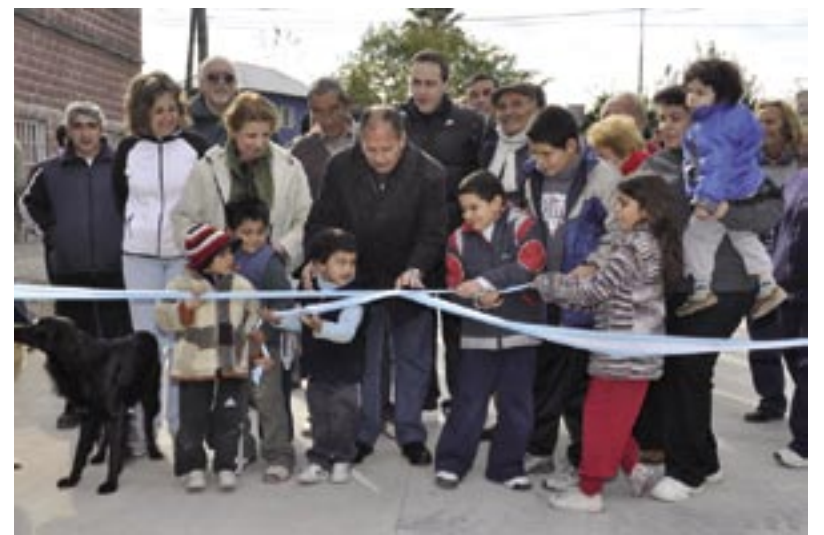
Corte de cinta en la calle Medina