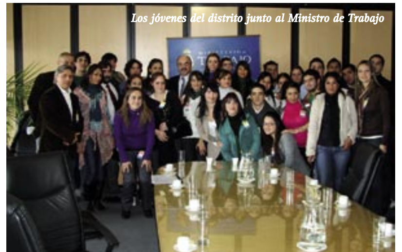
Los jóvenes del distrito junto al Ministro de Trabajo

ustedes hoy acá es muy bueno, significa que hemos logrado movilizarlos, que se han preocupado por ustedes mismos, que han podido editar esta revista y que al estar movilizados, están más cerca del mercado del trabajo”. “Esto no podría haberse logrado en forma individual – continuó el Ministro- acá estamos involucrados todos, ustedes, el Municipio, el Gobierno Nacional, con un mismo objetivo, que es que en la Argentina haya trabajo para todos”. Una de las chicas le dijo al Ministro que “es bueno saber agradecer, por eso nosotros le queremos decir gracias a Ud. porque a través de