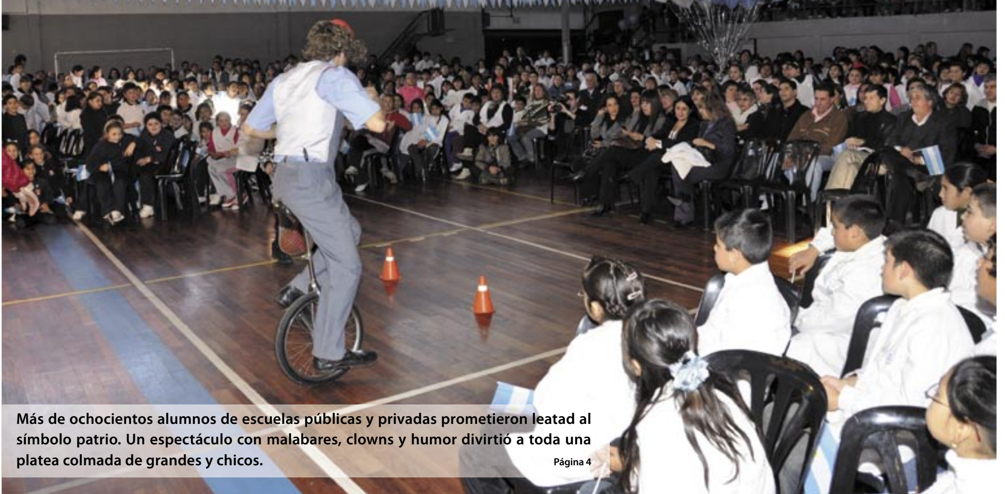
Más de ochocientos alumnos de escuelas públicas y privadas prometieron lealtad al símbolo patrio. Un espectáculo con malabares, clowns y humor divirtió a toda una platea colmada de grandes y chicos.