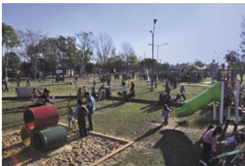
Panorama general de la plaza refaccionada

Los vecinos que entrenan el arte marcial Chaiu Do Kwan en la Asociación Civil René Favaloro, también hicieron