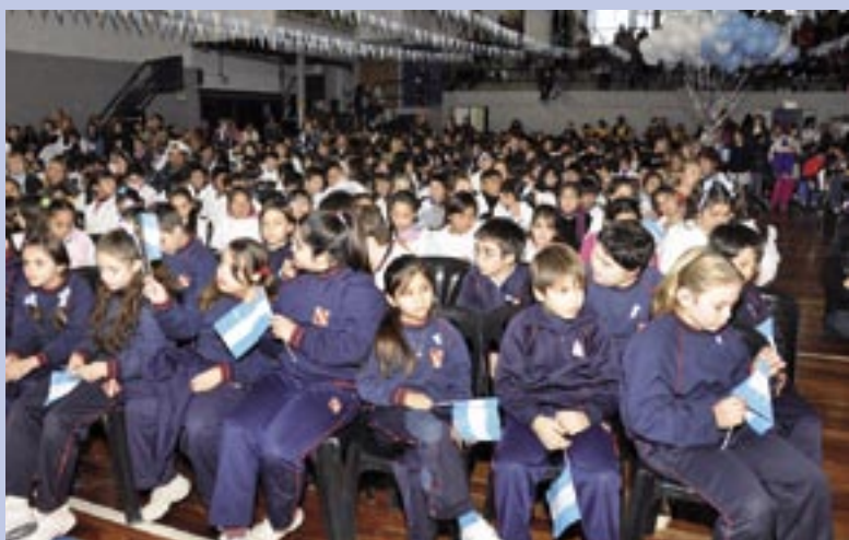
Un día inolvidable para todos los alumnos

Con un emotivo y multitudinario acto realizado en el Club GEI con motivo del día de la bandera, más de 800 alumnos de cuarto grado de escuelas públicas y privadas de Ituzaingó hicieron su promesa al símbolo patrio. El Intendente Alberto Descalzo fue el encargado de tomarle la promesa de fidelidad a los alumnos, que acompañados por sus familias, vivieron el tradicional