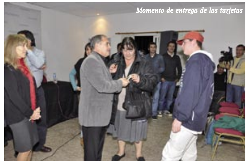
Momento de entrega de las tarjetas

que vienen haciendo los chicos y chicas del programa”. Además destacó que la articulación entre Nación, Provincia, Municipio y los vecinos “es necesaria para construir juntos un programa, que aún cuando pueda necesitar modificaciones, se esta formando para que cada uno de ustedes, pueda crecer y mejorar día a día”. Cabe destacar que a través del programa ENVION se definen líneas de acción que apuntan a garantizar el acceso a recursos y oportunidades para el desarrollo personal y la integración de los niños, jóvenes y adolescentes ■