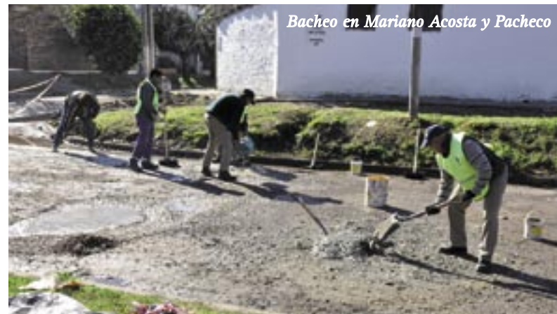
Bacheo en Mariano Acosta y Pacheco