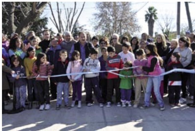
Corte de cinta en la calle Pérez Quintana