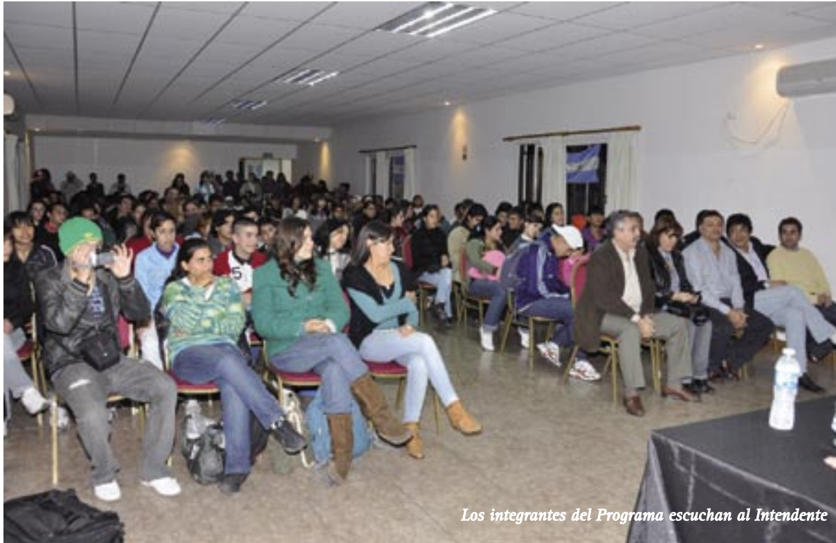
Los integrantes del Programa escuchan al Intendente

El programa de inclusión “Envión”, está dirigido a niños, adolescentes y jóvenes de 12 a 21 años en situación de vulnerabilidad social y conlleva un trabajo conjunto entre el Ministerio de Desarrollo Social de la provincia, el sector empresarial y la comuna.