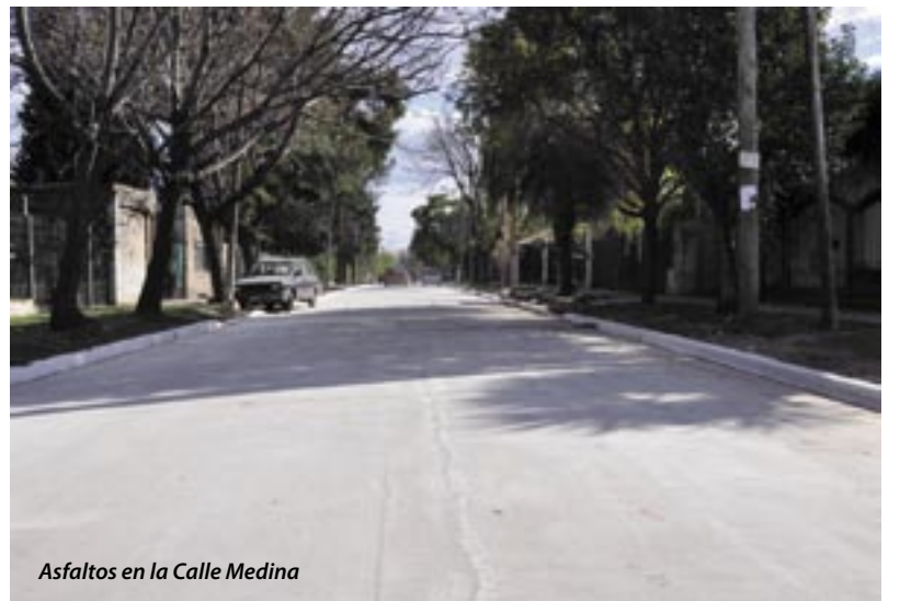
Asfaltos en la Calle Medina