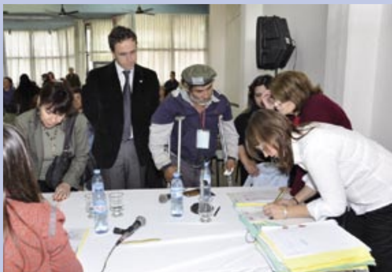
Uno de los 21 vecinos que firmó su escritura

“El programa me parece muy interesante, porque podemos aprender un montón de cosas, y nos ayuda a poder estudiar. Una de las cosas que nos enseñaron, que me gustó, fue el trabajo en las huertas.”