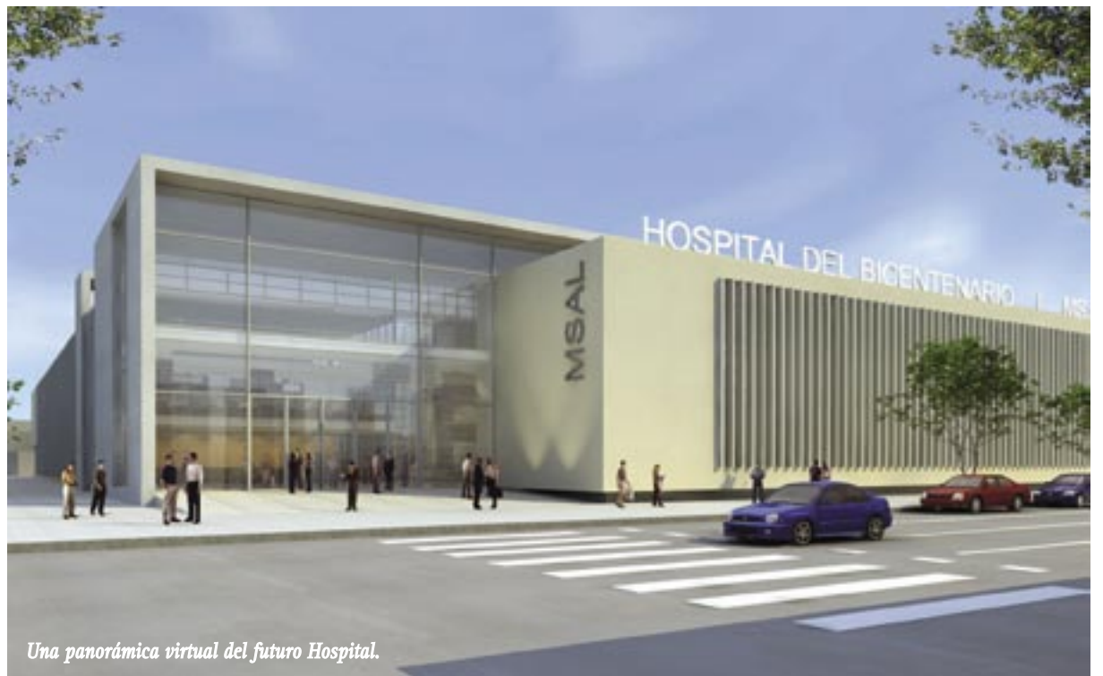
Una panorámica virtual del futuro Hospital.

“Este es un sueño muchas veces prometido pero pocas veces acompañado. Tuvimos que esperar mucho para que tanta insistencia diera sus frutos y hoy finalmente podemos estar felices de cumplir con uno de