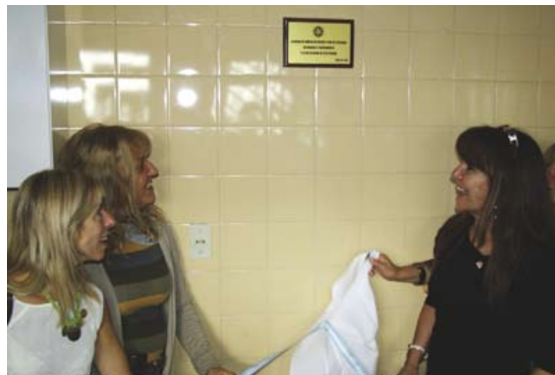
El descubrimiento de la placa recordatoria

te, teniendo como eje las cuestiones que nos plantean los vecinos y todos los que están cada día en los barrios, como ustedes los médicos que saben transmitir lo que la gente necesita”. “Tenemos un ida y vuelta con los vecinos, que da como resultado este tipo de avances”, pronunció Descalzo, previo al momento más conmovedor donde pacientes del centro, entonaron una canción bajo la premisa de que “todos somos parte de la sociedad que construimos”. Por último, las autoridades municipales junto con vecinos y representantes del Rotary Club, descubrieron la plaqueta que dejó por inaugurada la cocina y realizaron el corte de cintas que dio la apertura oficial al centro de día que ya venía funcionando.