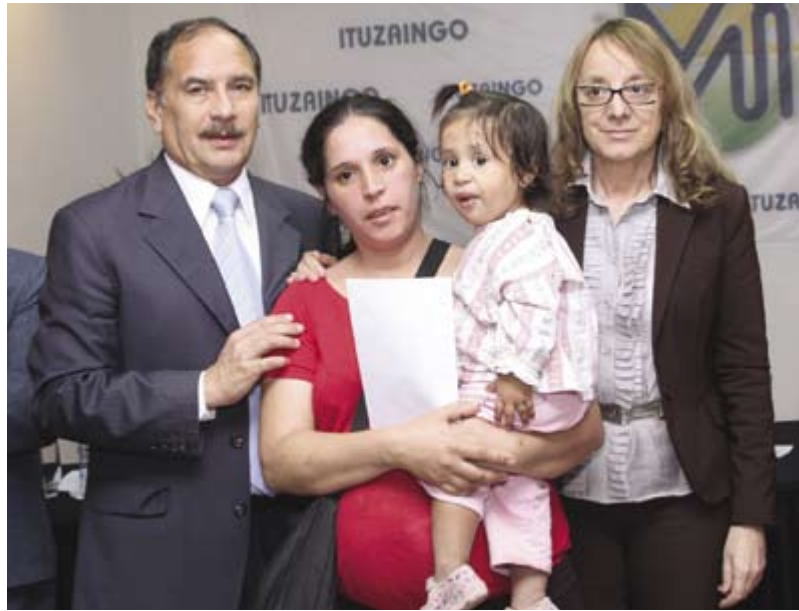
Alberto Descalzo junto a la Ministra Alicia Kirchner, entregando una de las pensiones

En el marco de la entrega de Pensiones, la Ministra de Desarrollo Social, Alicia Kirchner encabezó junto al Intendente Alberto Descalzo el acto en el cual se entregaron pensiones destinadas a vecinos mayores de 70 años (pensión a la vejez), a quienes presentan un 76% de invalidez y a las madres de 7 o más hijos.