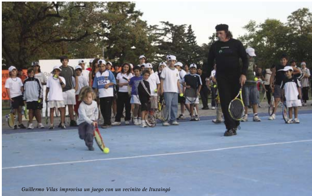
Guillermo Vilas improvisa un juego con un vecinito de Ituzaingó

Como parte de los programas provinciales destinados a incentivar y promover la educación en el deporte y en la seguridad vial, Ituzaingó recibió a dos deportistas de reconocida trayectoria