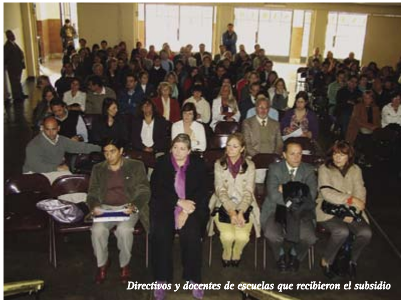
Directivos y docentes de escuelas que recibieron el subsidio

La Dirección General de Cultura y Educación de la Provincia de Buenos Aires, a través de la Dirección Nacional de Políticas Socioeducativas, otorgó un subsidio de movilidad a las Escuelas Secundarias Superior de Ituzaingó N° 1, 2, 3, 4, 5 y 6 y las Técnicas N° 1 y 2.