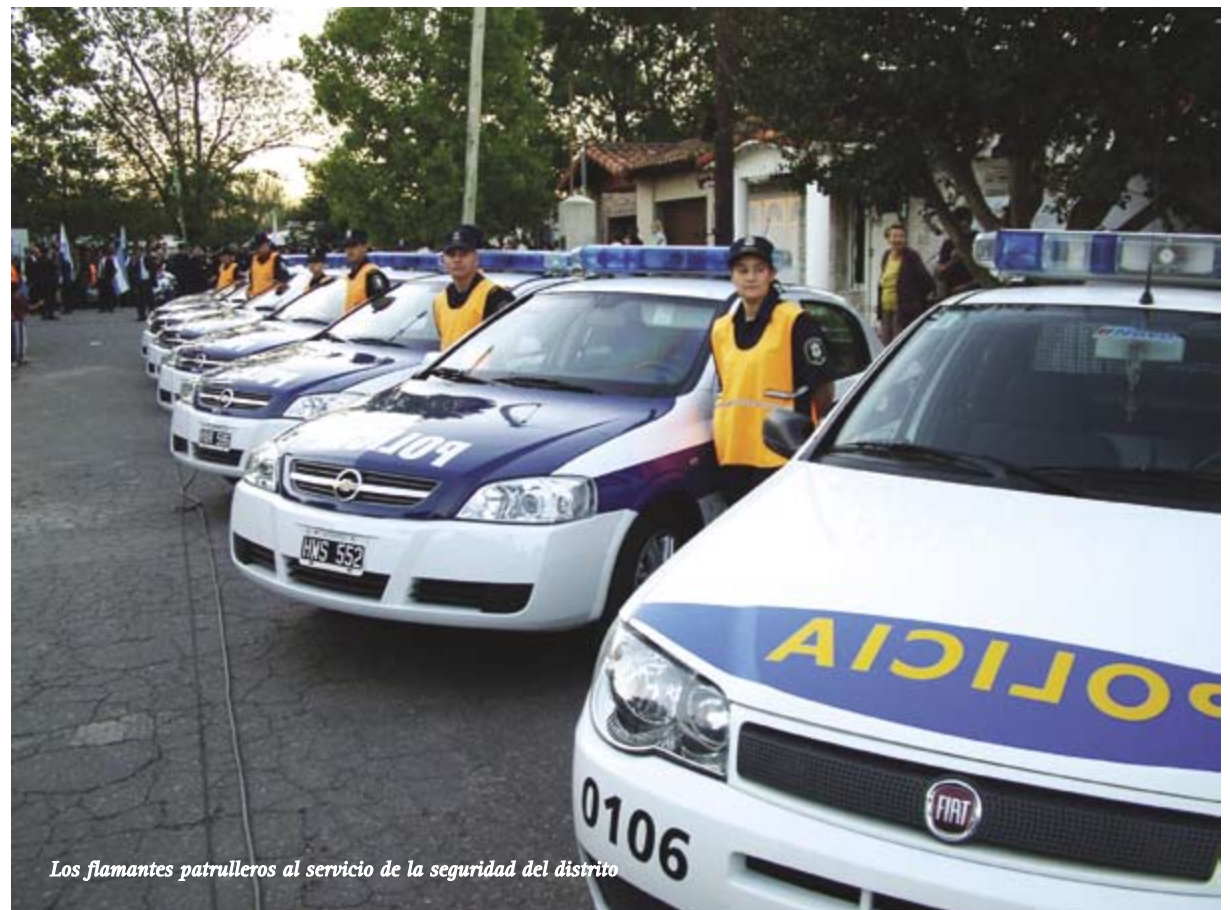
Los flamantes patrulleros al servicio de la seguridad del distrito

Además, hizo hincapié en que “no sólo más presencia policial va a